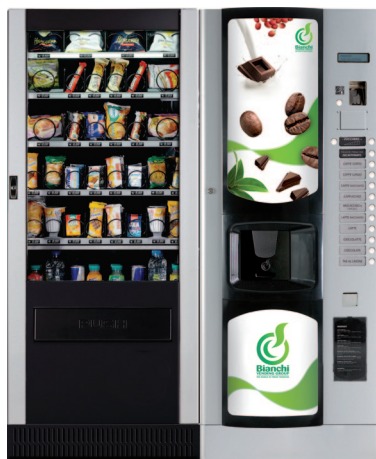
LEI 400 & BVM 676